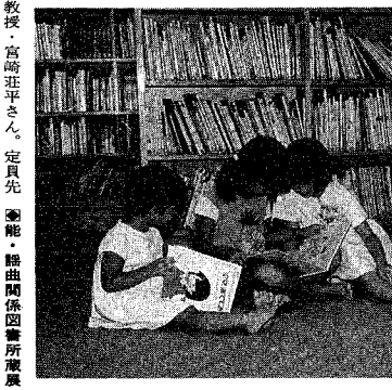
沼垂図書館の読書会風景

十月二十七日から十一月九日まで秋の読書週間です。この期間、沼垂、舟江図書館ではいろいろな催しを行います。皆さんの参加をお待ちしています。