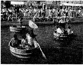
初めて乗るたらい舟で気分はすっかり佐渡の旅