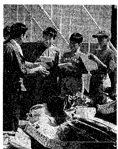
「なるほど、こんな苦労もあるのか」

現在、市内小・中学生十人五人が夏休みを利用して、自分たちの選んだテーマに、取り組んでいます。二週間、マリンピア日本海体験、消防局体験、園芸センターのテレビ紹介と四つのグループに分かれ、精力的に取材行っこの子どもたちは、どの目で見ても、耳で聞いても、手で触れて確かめたいといった取材を通じてさまざまなことを学んでいるようです。子どもたちがつくる市報に、ご期待ください。