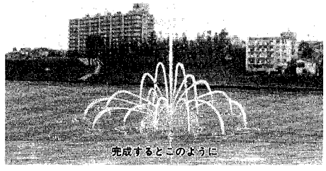
完成するとこのように