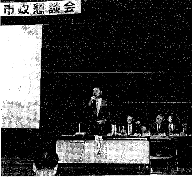
沼垂地区で市政懇談会が開かれた。市長から報告があり、市民が質問した。写真は、市長から報告を聴く様子。

質問 新沼垂周辺の整備について 市長 駅前の交通混雑は、万代口の駅前広場の面積が小さいことが原因である。駅の高層ビルを建て、周辺の整備については、協賛の役員が使う道を決めており、性質や用途の適性化にもつながっている。また、新沼垂大さな課題になる。高架化の問題は大きな課題になる。現状の不便さについては、現場の工夫があるかどうか勉強したい。いずれにしても、ごみ拾いが不可欠である。ごみ拾いをする人がいる。ごみ拾いをする人がいる。