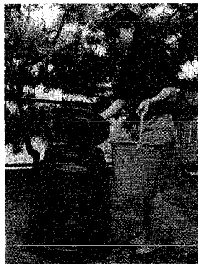
市では、ごみの減量化を図るため、家庭で出る生ごみをたい肥にする器具・コンポストを減額販売し、家庭まで配送します。コンポストは底のないポリバケツ状のもの。ふたを閉けて上から生ごみを投入して、中から徐々に発酵し、下のたい肥にする。畑や庭の土を減額販売し、家庭まで配送します。コンポストは底のないポリバケツ状のもの。ふたを閉けて上から生ごみを投入して、中から徐々に発酵し、下のたい肥にする。畑や庭の土を減額販売し、家庭まで配送します。