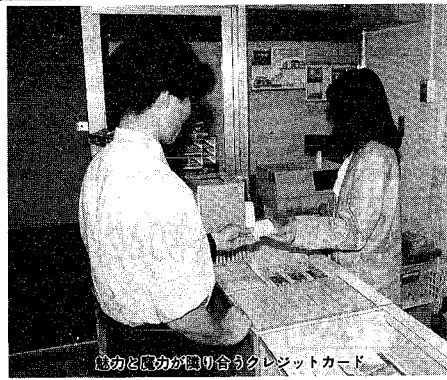
表 クレジットカードのしくみ

カード社会といわれる現クレジットカードは、現金を 在りさまざまだカードが発行 持ち歩かなくても、商品を され出回っています。中でも 買ったリサービスを受けたリ