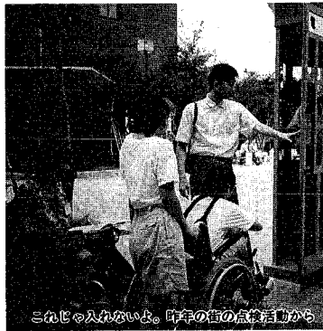
「わんぱく入れないよ。昨年の街の点検活動から」

市ボランティアセンターで、今年も中学生、高校生、大学生などを対象に「夏休みボランティア体験学習」のつどボランティア活動を体験して、 「わんぱくキャンプ」を開催します。このつどは、今年も中学生、高校生、大学生などを対象に「夏休みボランティア体験学習」のつどボランティア活動を体験して、