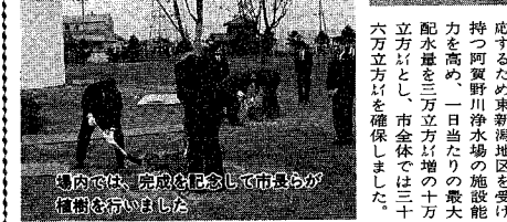
市内では、完成を記念して市役所が植樹を行いました。