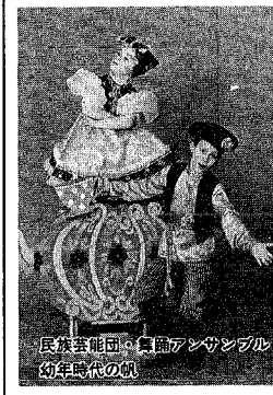
民族芸能団「舞踊アンサンブル」幼年時代の頃

市民の皆さんとウラジオストク市からの参加者との親睦を深めてもらおうと「友好の夕べ」を開催します。ロシア料理や民族芸能を楽しみ、語り合ってください。