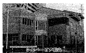
シルバーピア石山

市では、脳卒中の後遺症や老化などによる体の不自由な人、能訓練を行って、います。一（ただし、通所される人）部、総合コミュニティセンター、西地区事務所分庁舎、特別養護老人ホーム大山台、物を作ることを通して手足の力、も取り入れられました。どうぞご利用ください。 対象者 四十歳以上の市民、体が手足の不自由な人（ただし、通所される人）部、総合コミュニティセンター、西地区事務所分庁舎、特別養護老人ホーム大山台、物を作ることを通して手足の力、も取り入れられました。どうぞご利用ください。