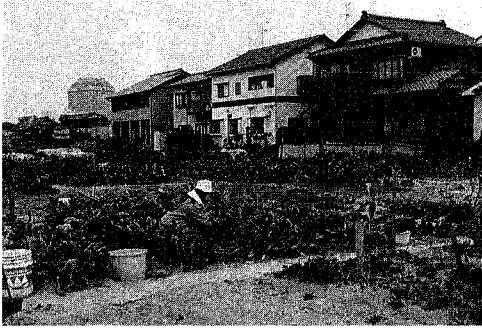
募集する農園と区画図