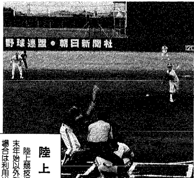
野球連盟・朝日新聞社

もうすぐ春。屋外スポーツを楽しむ人たちは、待ちに待ったシーズンがやって来ます。冬期間閉鎖していた市の屋外スポーツ施設も四月からオープン、利用申込をはじめます。大空の下、心身ともにリフレッシュ、思う存分、体を動かしてみませんか。申し込み、利用料、大会開催など詳しくは体育施設管理センター(一番堀通町3-1陸上競技場内、☎266-8111)へ ※ただし、西総合スポーツセンターの利用は同センター(五十嵐1-6368 ☎268-6400)へ