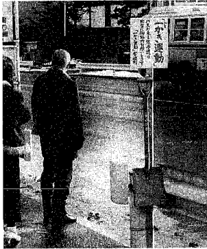
除雪車は家の出入口まで、機械除雪のための前や駐車場で、人に除雪できませんし、機の出入口がよぶがれることがよくあります。