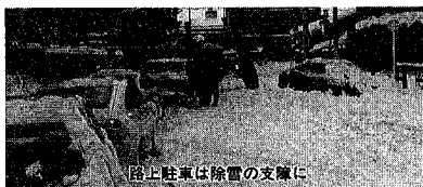
路上駐車は除雪の支障に

除雪作業を円滑に行うため、十二月十五日から三月十日まで、また大雪の際には、路上駐車禁止を要請します。