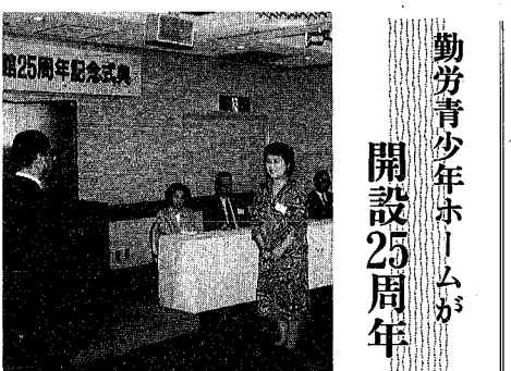
勤労青少年ホームが開設25周年記念式典

和三十六年四月二日から昭和 四十九年四月一日まで生まれ れた人(給食調理員、昭和三十 九年四月二日から昭和四十九 年四月一日までに生まれた 女性) 試験内容(二次)保母筆記 試験(教養・専門)と適性検査 並にその他の職種、適性検査 試験科目・申込用紙 人事課 (学校町通一六〇一)市 役所本館四階)で差し上げま す。郵送を希望される人は、 2073番へ 人事課(管内線 返信用封筒(あて先を明記し