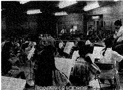
みんなであつくり新湯の文化

七月に設立された市芸術文化振興財団では、市民が主催する文芸講演会や鑑賞会、芸術文化活動の発表などへ助成を行います。助成は限度額を定めて行う一般助成と規模