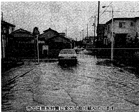
市では雨水対策に全力で取り組んでいます