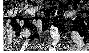
350人の人たちが参加

十月二十七日、にいがた女性大会の本大会が、万代市民会館で開かれました。女性大会は、男女が共に生きる社会をめざして、十月十日から八つの分科会とにいがた女性会議との協賛事業が、