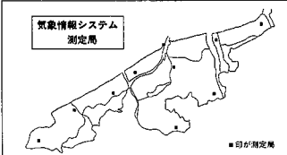
気象情報システム測定局

市街地の雨水は、主に道路側溝から下水道管を経てポンプ場から信濃川や阿賀野川に放流されるため、ポンプの運転は、浸水被害に大きな影響を与えます。気象情報システムの導入により、全市の降雨状況が画面に表示されるため、ポンプの運転操作が迅速・合理的に行えるメリットがあります。