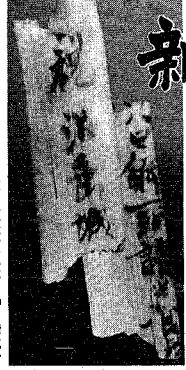
八幡林遺跡の木簡「沼垂城」