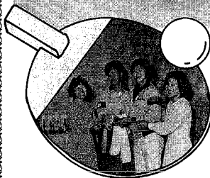
あの熱いラリーが再び新潟に(上)