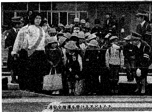
交通安全指導を受ける子どもたち