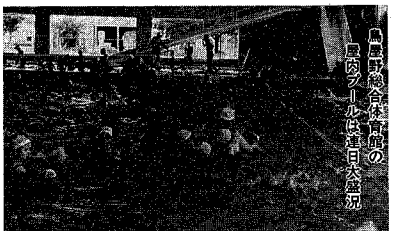
鳥屋野総合体育館内の屋外プールは毎日大盛況