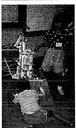
美術館でビー玉コースターづくり。できあがりに満足