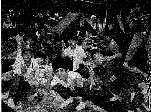
石山地区公民館で少年キャンプ入門(写真は屋内手づくりキャンプファイヤー)