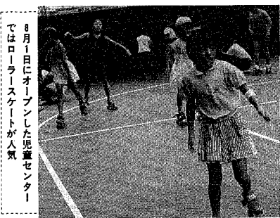
8月1日にオープンした児童センターではローラースケートが人気