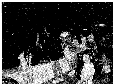
マリニピア日本海は何といても人気No.1。「ウミガメはどこまでいったかな……」

梅雨明けが速くなったこの夏。しかし子どもたちにとって、天候なんかはなんのその。海や山、そして市内の身近な場所まで夏休みを思う存分満喫。人生のページをつづっています。市の施設も子どもたちになくさん利用され、夏休みを楽しく、有意義なものとしています。ご覧下さい、子どもたちの元気なこの賑々夏休みはまだ続きます。