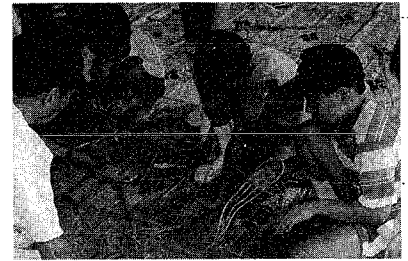
中央公民館でわらせうりづくり