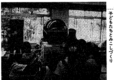
大畑少年センターでハバロフスクの子どもたちとみこしづくり