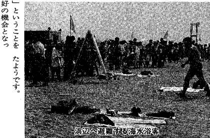
浜辺へ避難する海水浴客

参加された皆さんにとって、たやすく避難」ということを、たやすく、体で覚える絶好の機会となつた。