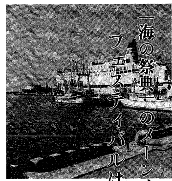
会場は広々とした小針浜

通船川 山ノ下開門通航止め 期日 7月27日～8月11日 問い合わせ 新潟土木事務所(☎273-844)