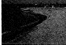
会場は広々とした小針浜

小針浜を舞台に新しい市民のお祭りが誕生します。名づけて「夕日海岸まつり」海の盆。八月十一日にその産産を祝します。この企画は、海の祭典の開催や海、浜辺、そして日本海夕日コンサートのステージを生かし、市民がつくり、市民が参加して楽しめる催しがあはれは.....。こんな素晴らしい盆祭り、夕日海岸まつり海の盆市民委員会が中心となって開催するものでも、さまざまな団体の協力も、市が全面的にバックアップするあたりに誕生することになった。 八月十一日は朝の八時から夜の九時過ぎまで、水、水、キイトワドとした新潟の自然の中、たくさんの方が心ゆくわで、思いっきり楽しめる場所ができます。柱は夕日と潮風コンサート、ビーチパーティー、