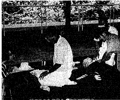
日ごろからの備え—救急法講習会

赤十字といえば災害救護や 献血などでもよく知られて います。ではわたしたちの身 にはどんな赤十字活動があ るのでしょうか。市内で活動 を支えている社員の数は、 おまわり広場として、赤十 字奉仕団を中心として、各 市区での清掃やお寄りマッ クスの清掃やお寄りマッ