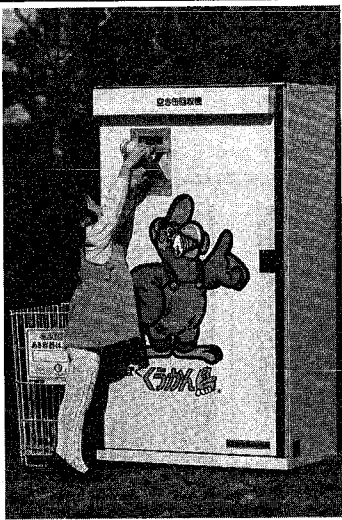
わたしも資源リサイクルへ空き缶を入れると抽選補助券が出てきます

毎日大量に出される廃棄物。その中で空き缶は貴重な資源として注目されています。特にアルミニウム缶は高く評価されています。そうした「くっかん鳥」を東地区事務所と坂井輪