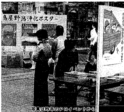
写真は昨年のPRイベントから

毎年六月五日から十一日は身近な環境を見つめ直し、よりよい環境づくりの契機とする環境月間です。今年も環境月間として、五月二十一日から七月五日までを環境月間とし、全国でさまざまな行事を実施します。 市では今年も、環境にやさしい暮らしと社会を求めて、をスローガンに、期間中次のような行事を実施します。参加して、みんさん環境月間について考えてみてはいかがでしょうか。