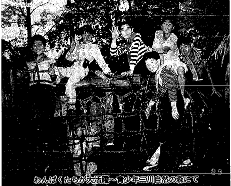
わんぱくたのび大活用～少年三川自然の森にて