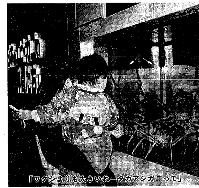
「のんびりも大いにお楽しみ」

いつでも「海」を体験でき る水族館マリニア日本海で は、すっかり春めいてくま はすの前にして、水の生物 たちがおもちゃ張り切っ て、いろいろな魅力、ま ま、お楽しみください。