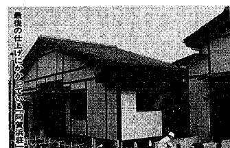
最後の仕上げの阿賀浜荘

にいがた恵風園には デイサービスセンターも 特別養護老人ホーム「にいがた恵風園」は、市などの助成を受けて社会福祉法人「仁成福祉協会」が、鶴岡新田三階建ての建物、延べ床面積約三千九百平方メートル、建設費約三千五百万円の大規模な施設です。常時介護を必要とし、家庭 施設は、一階が事務室、医務室、入所者の居室などの二階は入所者の居室が廊下の両側にすべり階段、ゆったりと憩える食堂やふもも掛けられたいす、三階はデイサービスセンターなどです。リハビリ室、介護教育室、ボランティア室など配置されています。このほかカンルー、日光浴や人工芝の広い屋上広場で運動できます。入所、利用など詳しくは市老人福祉課へ。