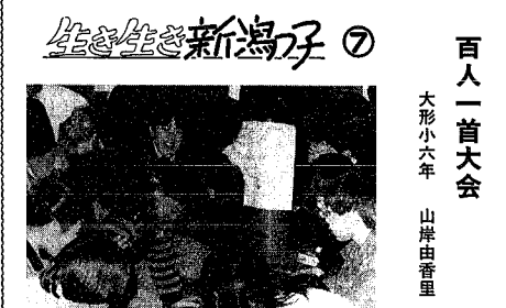
生々生々新潟子 百人一首大会

「秋の田のい」は、毎年三学期になると、四年生以上の子のクラスから、こんな歌が聞こえま。大形小学校では、毎年一月に百人一首大会が行われます。