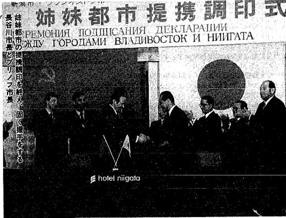
式調携提都市姉妹 РЕМОНИА ПОДПИСАНИЯ ДЕКЛАРАЦИИ ЖДУ ГОРОДАМИ ВЛАДИВОСТОК И НИИГАТА

ウラジオストク市は、ソ連邦ロシア共和国沿海地方の行政の中心で、シベリア横断鉄道の新着点、太平洋に連なると大貿易港、工業生産都市でもあり、教育・学術の中心地とさまざまな顔をもち、