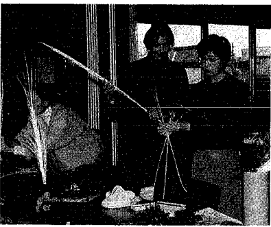
新潟に住む外国人は年々増えています(新潟国際友好会館での生け花講座座)

新潟市の国際化はますます進み、新潟に住む外国人も年々増えています。市では、外国人が新潟での生活に早くとかけるよう国際交流のようす、市の文化のガイドを作成、十九日から市民課外国人登録窓口、新潟国際友好会館に備えます。このガイドはB5判百六十ページ。内容は生活の基礎的データとして、住宅、電気、ガス、水道などの使用手続のほか、市の国際化に役立つこと