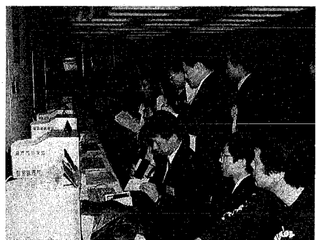
楽しいコンテストです。親子、友達同士でどうぞ