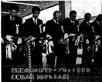
国際線出発ロビー前でデブゾットと写真 撮影入場 (左から8人目)

航空需要が著しく伸びている新潟空港で、混雑緩和のための工事が行われていた国際線出発施設が完成、市や県など関係者が出席して二月二十日、落成式が行われ、完成式が行われ、工事は新潟空港ターミナルビル株式会社(中野達社長)が進めていたもので、完成した出発施設は現在の国際線出入国施設が入っている西側に建てられ、二階建てで延べ床面積約七百五十平方メートル、総事業費二億五千万円となつて、ターミナルビルとは二階の渡り廊下で接続され、二階でロビーと出国検査場など、一階が出国待合室、免税売店、喫茶カウンターなどとなつて、免