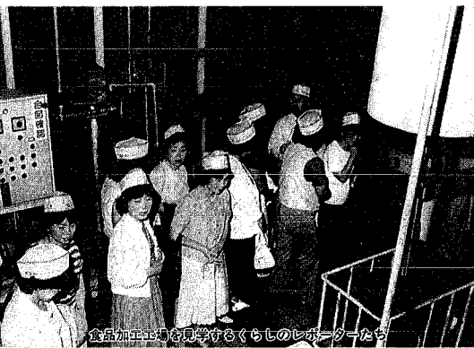
食品加工工場を見学するくらしのレポーターたち

市では消費生活に関する意見や要望をお聞きしたり、情報のアンテナの立場を担って、報告をいただいたり、平成三年度のくらしのレポーターを募集します。