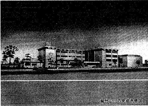
紫竹山小の完成予想図

市街が進み、児童数が急増している笹口小学校を分離して新しい小学校を、紫竹山一に紫竹山小学校の建設が進んでいます。現在約千新小学校の建設に着手した。 開校は4月 新校舎での学習は2学期から 紫竹山小学校の建設は、約二町の敷地に鉄筋コンクリート造り四階建ての校舎(普通教室十八、特別教室八、給食室、管理諸室を配置)と体育館、プール、グラウンドをつくろうと進められています。施設の特徴は、校舎中央部分の各階に三教室分の広さの多目的ホールを設け、これからの教育の多様化に対応できるように配慮。またグラウンドは市街地の小学校では珍しい二百メートルと二百二十メートル直線走路がとれるよう計画しています。 通学区は、米山三三六丁目、笹西一丁目、紫竹山一丁目、紫竹山三丁目、紫竹山十一番、紫竹山。 校舎は今年八月に完成、順次、体育館、プール、グラウンド、緑地などが整備されていきます。 開校は四月一日(新校舎ができるまで笹口小学校で学習)で、二期から新校舎で学習することとなります。 学校の建設は、このほか、濁川中学校、大淵小学校の増築が三月に完成、栄小中学校の改築なども進められており、市では学校教育の施設面での充実にも力を注いでいます。