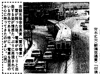
市観光協会会長賞「雷の電音」 雷が降った瞬間を捉えており、雷の音が聞こえてくるような感じがする。特に電音の面を捉えてきたのがよい。(同)

応募作品百三十九点の中からは選ばれた各賞の受賞者から選ばれた各賞の受賞者は次のとおりです(敬称略)。