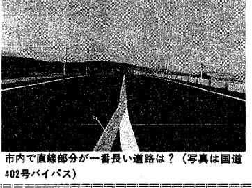
市内で直線部分が一番長い道路は？(写真は国道402号バイパス)

③ 脳の神経細胞を破壊する ④ 分解能力が弱い アルコールは肝臓でアルコール脱水素酵素によりアセトアルデヒドになります。未成年者の脳は分解されにくく、アセトアルデヒドは分解が遅く、同じ量の酒を飲んでも長い時間体内にとどまると体に影響を与えます。 ⑤ 未成年が飲酒すると依存症になりやすい アルコールを飲み続けてから二、三日飲まずにすると、努力せずに楽しい気分になる方法を覚えているうちに、人とのほかの楽しみ方を学ぶ意欲が減ってしまいます。 ⑥ 人生の糧を狭めてしまう アルコールは依存性、習慣性があります。お酒によって、努力せずに楽しい気分になる方法を覚えているうちに、人とのほかの楽しみ方を学ぶ意欲が減ってしまいます。