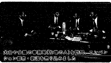
大会や会議の事務局(右端の人)を訪問、コンベンション都市を、新潟を売り込みました

新潟市にコンベンション(大会や会議など)を呼びこもうと、市や商工会議所ホテラ・旅館などで組織する新潟コンベンション・ビューローでは、今年も十月二十三日から二十五日にかけて東京で勝