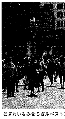
にぎわいをみせるガルベスタンのストランド通り

ガルベスタンは、アメリカ合衆国テキサス州南東部、メキシコ湾に浮かぶ島で、人口約七万人。面積は新潟市とほぼ同じ程度の約二百四十平方キロの港湾都市です。本土と