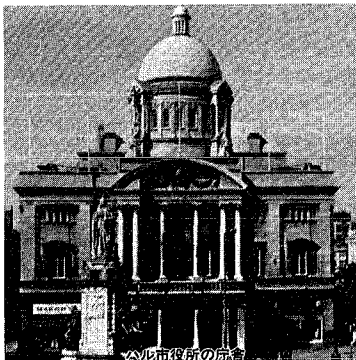
ハル市役所の庁舎