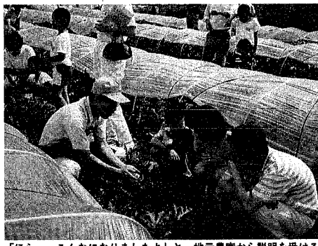
「ほらっ、こんなになりましたよ」と、地元農家から説明を受けるオーナー (南浜ランドで)

農家と消費者が契約を交わし消費者が農作物のオーナーとなり、栽培を農家が取り、収穫を祝うと同時に農家を消費者が行う「市民ランド」。今年南浜と坂井輪の二カ所で開設し、多くの応募をいただきました。同ランドでは、いよいよ収穫の時期を迎え、両区では地元農協の協力を得て収穫祭を開催する運びとなりました。 市ではこの収穫祭にオーナーだけでなく、広く市民のみなさんからも参加してもらい、収穫を祝うと同時に農家を消費者との交流を深めていきたいと思います。 「山盛り」の収穫祭は、収穫した野菜、漬物、ハム、ソーセージなど地元農産物の販売や新米おこしなどの配布もつぎ大会と、汁サレシなど盛りだくさんの内容となっています。 収穫祭の日程は次のとおりです。