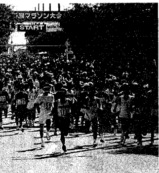
昨年の第7回新潟マラソンのスタート

第八回新潟マラソン大会が十月十日「体育の日」に、新潟大学から越後七浦サイードライン(開閉折り返し)の四二・一九五の区間で行われ、今年も大勢の参加者で盛況です。今年大会の参加予定者は、三二都府県からの申し込みを含む千七百八人で、昨年の参加者を超える過去最高の申し込みとなり、フルマラソンは十八・十九歳代が七百九人、五十歳以上が二百九十七人となっています。このうち、車イスランナーが六人、視覚障害者が四人出場します。また、日本長距離界の一流選手を招く招待選手は、本田技研工業陸上部の十人が、フルマラソンに出場する予定です。大会当日は市民のみならず、温かい声援をお願いします。種目別の選手とスタート時間は次のとおりです。フルマラソン(五百二十三人)：正午、ハーフマラソン