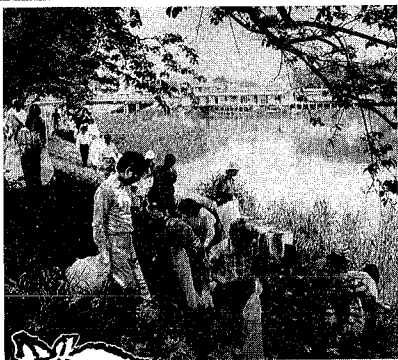
毎年多くのごみが集められます

新潟の交通渋滞を緩和するため建設が進められている国道116号新潟西バイパスで、昨年三月の黒崎インター～小新聞インター間(二)の部分開通に続き、さらに小新聞インター～亀貝インター間・四が十月十二日正午に開通することになりました。 坂井輪地区や、新潟島を、着手以来、まず黒崎インター～通過する車両を国道116号、小新聞インターが開通。こ と北陸自動車道、新潟バイパスに続いて今回の亀貝インターなどと結んで流す西バイパスまで伸び、供用区間は合計 下山田～新潟市曾和の全長 三三・六キロになります。建設省が早八・六、昭和六十一年に工事期全般開通を目指している