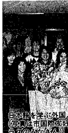
日本語を学ぶ外国人が来ています(左から市鳥屋野総合体育館の日本語指導法講座)

本市国際交流協会では、大交流の機会を増やしてきて好評をいただいた六月の講座「How to teach Japanese」に続いて、日本語の指導法講座第二弾を開催します。今回は、日本語を学ぶ外国人が来ています(左から市鳥屋野総合体育館の日本語指導法講座) 対象 十八歳以上の人、昼・夜とも四人(応募多数の場合は抽選)※外国語が多少できる人は問いません 参加費 資料代二千元 申し込み 十月十三日(必着)まで 申し込み先 市国際交流協会(〒951-8501 上大川前通二、三好マンション二階) 電話 225-2777