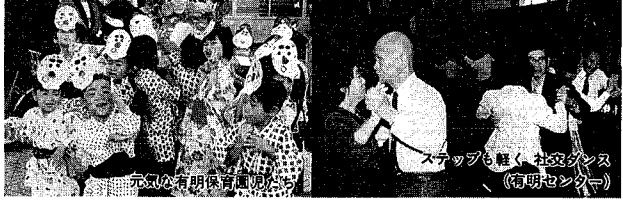
元気の有明保育園児たち