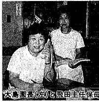
大島園長(左)と森田主任係母