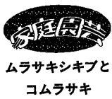
ムラサキシキブとコムラサキ

一般に栽培されているムラサキシキブは、オムラサキシキブ、ムラサキシキブ、コムラサキの三種類があります。いずれも花芽は五月ごろから春に伸びた枝の各節にでき、六・七月に開花、結実し、九月ころから色づきます。この紫色の実を、平安時代の才媛紫式部にたとえ美称したもので、魅了の樹名が人気を呼んでいます。落葉低木とされているもの、ムラサキシキブやオムラサキシキブは