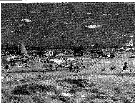
マナーを守って楽しい夏のひとときを

海水浴の楽しみ方も人それぞれ。浜屋のない海岸にパラソルを立てサマーヘッドを置いて、持ってきたジュースやビールでのどを潤す。そんな姿も見られます。ところが、そんな人たちの立ち去ったあとに、ごみが置き去りにされていることが多々あります。さっさとではおしい弁当、冷たいジュース、甘い