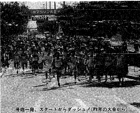
号砲一発、スタートからダッシュノ(昨年の大会から)

今年で八回目となる新潟マラソン大会は十月十日(体育の日)に開催される。スポーツの秋を飾るこの大会は市民行事としてもすっかり定着、市内はもとより全国からランニング愛好者が集まり、日ごころの練習成果を試す格好の舞台です。また、毎年、国際的にもトップレベルの招待選手が出場。沿道から温かい声援を受けながら日本海を横に見て走る快きは格別です。友人同士、ご夫婦、グループなどでお気軽に参加下さい。 種目「男子」①フルマラソン②ハーフマラソン③10kmの申し込み、市民相談室(市内線2062番)へ、※先着順で利用日を決定します。また利用日を電話で予約して下さい。 利用日 九月、来年三月、午前九時～午後四時(土・日曜日、祝日は休み) 対象 市内の自治、町内会、サークルなど二十人以上の団体(参加費も金は除く) 参加費 無料。有料施設の入場料は参加者が負担。 案内 市民相談室の職員が添乗、案内します。 その他 見学終了後、施設や市政への意見を寄せてもらってもらうとともに、ご意見をうかがうために実施しています。初めての団体は、募集の都度、本紙でお知らせします。