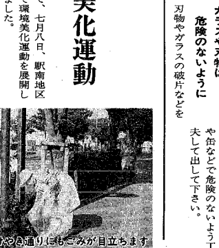
「住みよい郷土建設協会」

「環境美化運動」 七月八日、駅南地区で環境美化運動を展開しました。東野線橋からブララカ2にかけての道路と公園を地区の自治会が中心となつて総勢約四百人が清掃。人や車などの手で汚れたところを洗い流していました。