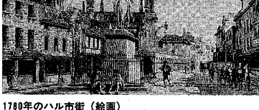
1780年のハル市街(絵画)

十三世紀の中ごろの大洪水... 洪水になりやすくて、多くの困難を克服して、ハル市という名のまちが初めて知られるようになったのは、十二世紀も末のことであった。